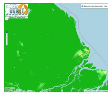
Previsão de Risco de Fogo